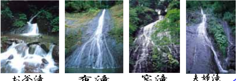
お釜滝 布滝 窓滝 夫婦滝

4 柳の滝 権現山 (565m) 中腹にあり、大小五つの滝から成り立っています。不動滝は剣豪佐々木小次郎が秘剣「燕返し」をみだした滝と言われています。平成17年の福井豪雨で登山道に甚大な被害を受けましたが、現在は復旧しています。周囲にはコナラやミズナラの林が広がっていて、清流を遊んだところには、松が嶽権現が祀られています。