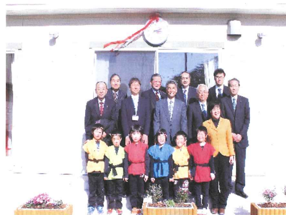
屋外用時計 (藤倉児童館・平成27年3月)