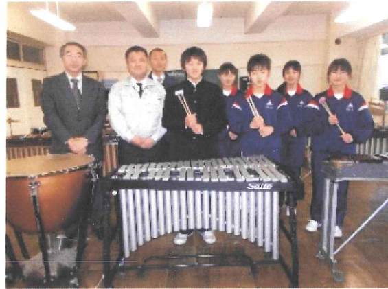
ビブラフォン (塩竈市立第三中学校・平成24年9月)