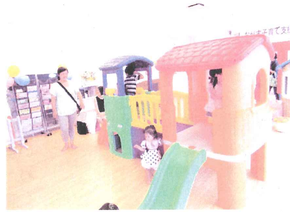
大型遊具 (しおがま子育て支援センター・平成25年8月)