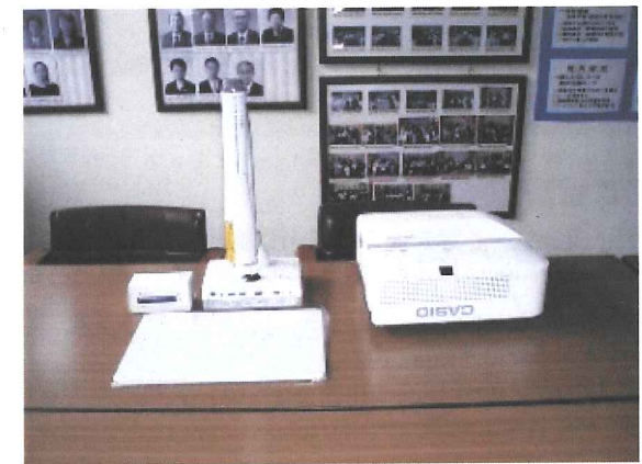
プロジェクターと書画カメラ (塩竈市立玉川小学校・平成27年8月)