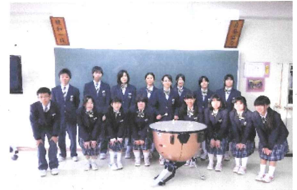
ティンパニ (塩竈市立第二中学校・平成25年9月)