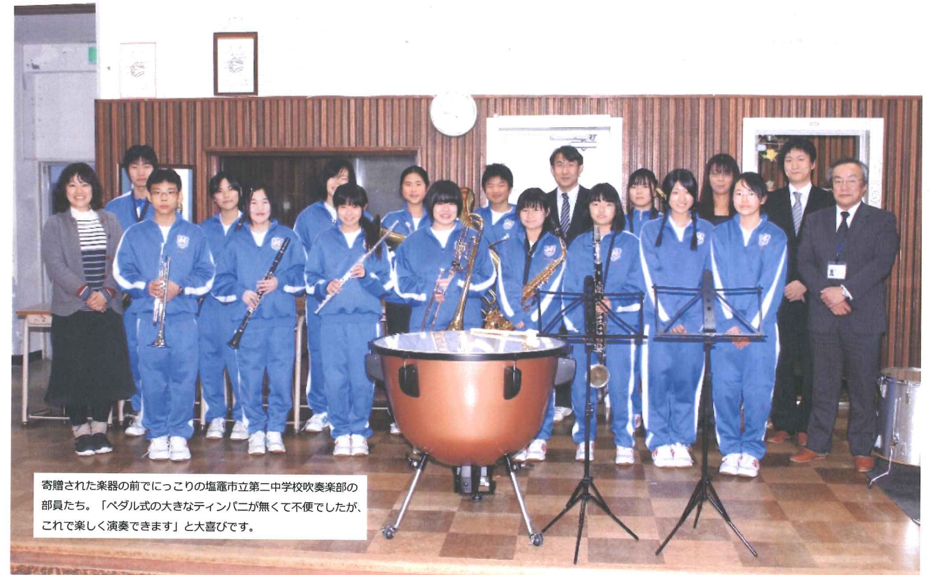
寄贈された楽器の前でにっこの塩竈市立第二中学校吹奏楽部の部員たち。「ペダル式の大きなティンパニーがなくて不便でしたが、これで楽しく演奏できます」と大喜びです。