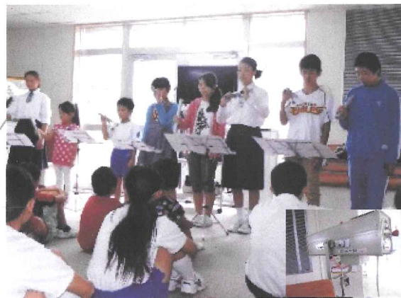
トーンチャイムとスポットライト (塩竈市立浦戸小中学校・平成26年9月)