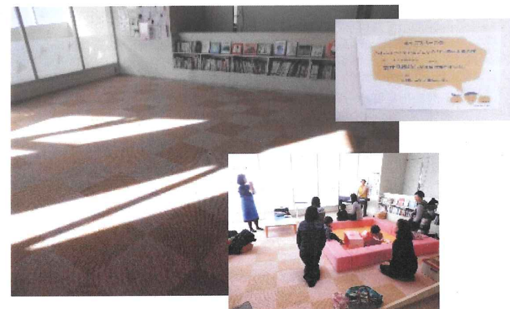
パネルカーペットとブロックパーテーション (ふれあいエスパ塩竈・平成28年2月)